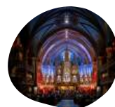
Basilique Notre-Dame de Montréal