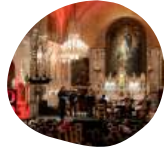
Chapelle Notre-Dame de-Bonsecours