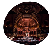
Église Saint Jean-Baptiste