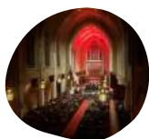
Église St. Andrew & St. Paul