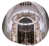
Oratoire Saint-Joseph du Mont-Royal