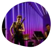
Concert électro- baroque